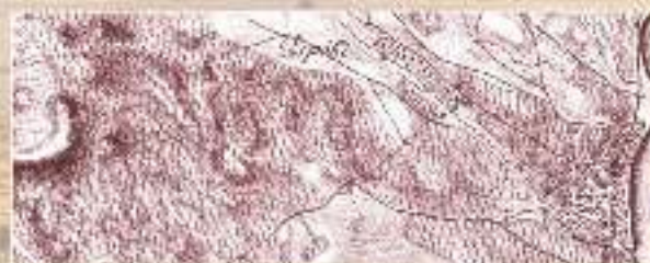
A tanösvény leglátványosabb állomása a város egyik leglátványosabb és legérdekesebb állomása.

A tanösvény leglátványosabb állomása a város egyik leglátványosabb és legérdekesebb állomása. A tanösvény a város egyik leglátványosabb és legérdekesebb állomása.