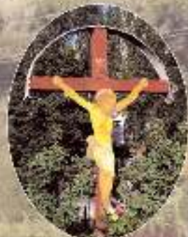
A tanösvény leglátványosabb állomása a város egyik leglátványosabb és legérdekesebb állomása.