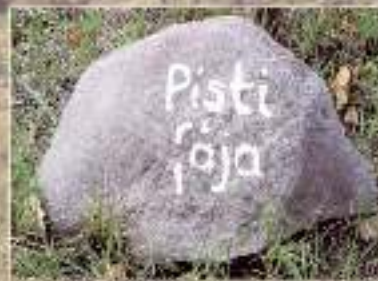
A tanösvény leglátványosabb állomása a város egyik leglátványosabb és legérdekesebb állomása.